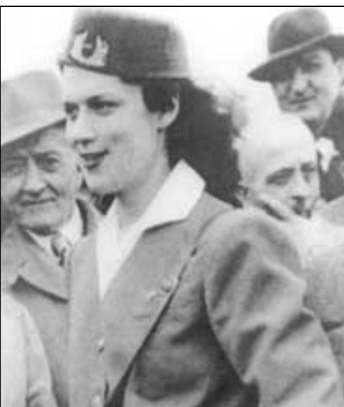
Anni Cinquanta: il completo è delle Fontana