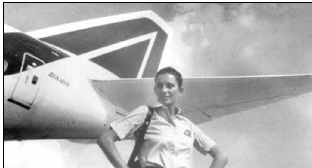
Anni Ottanta: lo stilista di turno per la hostess in maniche corte è Lebole Moda