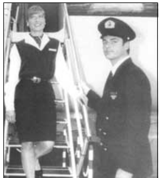
Anni Novanta: la divisa è firmata Mondrian

Le "ragazze volanti" sono sempre state anche delle ambasciatrici per il mondo della moda